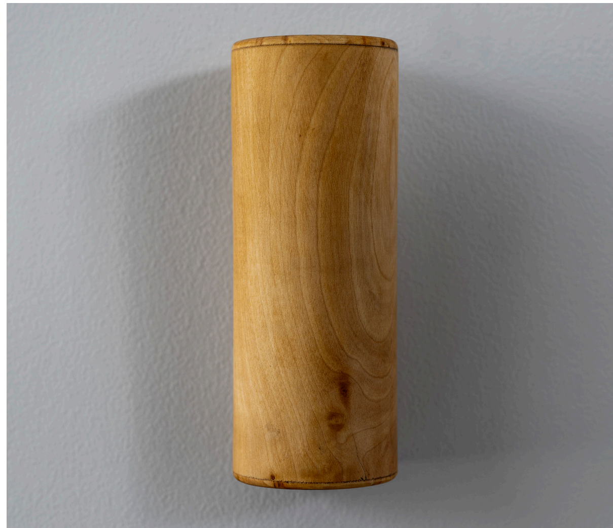
Heiðmörk 21.12.2221 - 22.12.2022, Suður. Æting (Photogravure) 18 x 22 cm birkiaskja 6,5 x 18 cm. 2023