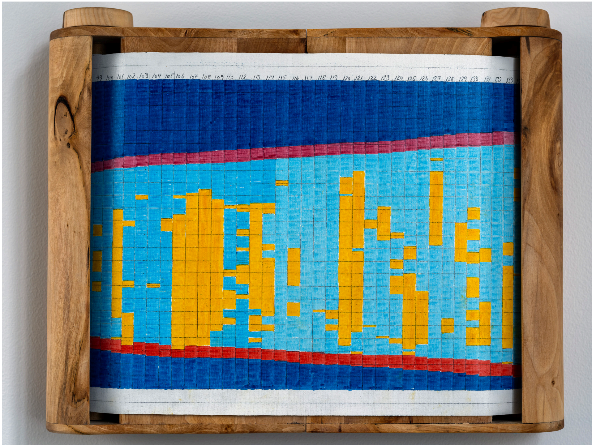
Almank. Vatnslitur á striga í birkiöskju, 365 cm, 34 x 42 cm, 2023