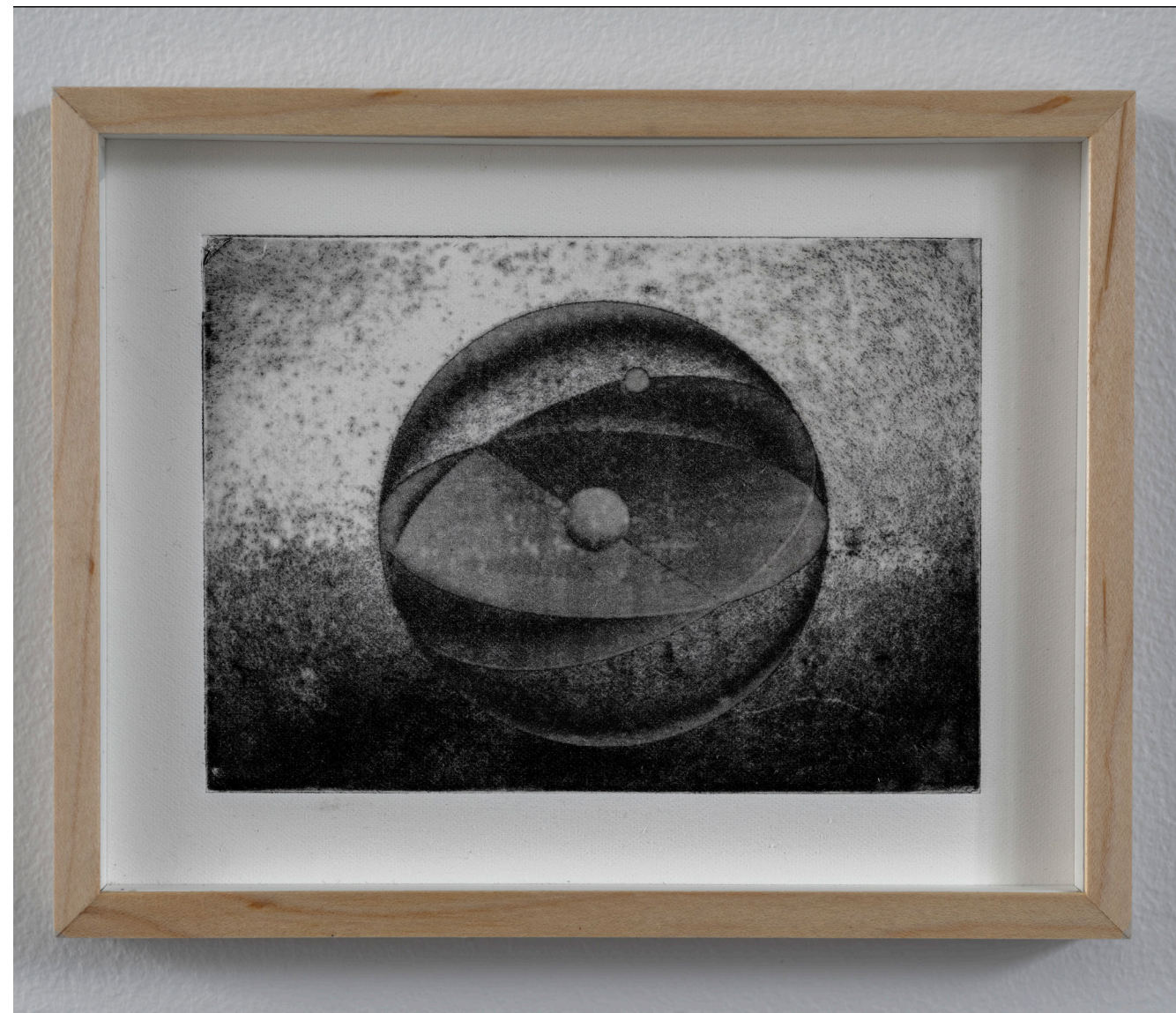
Sólbaugur. Æting (Photogravure) 14 x18 cm. 2023