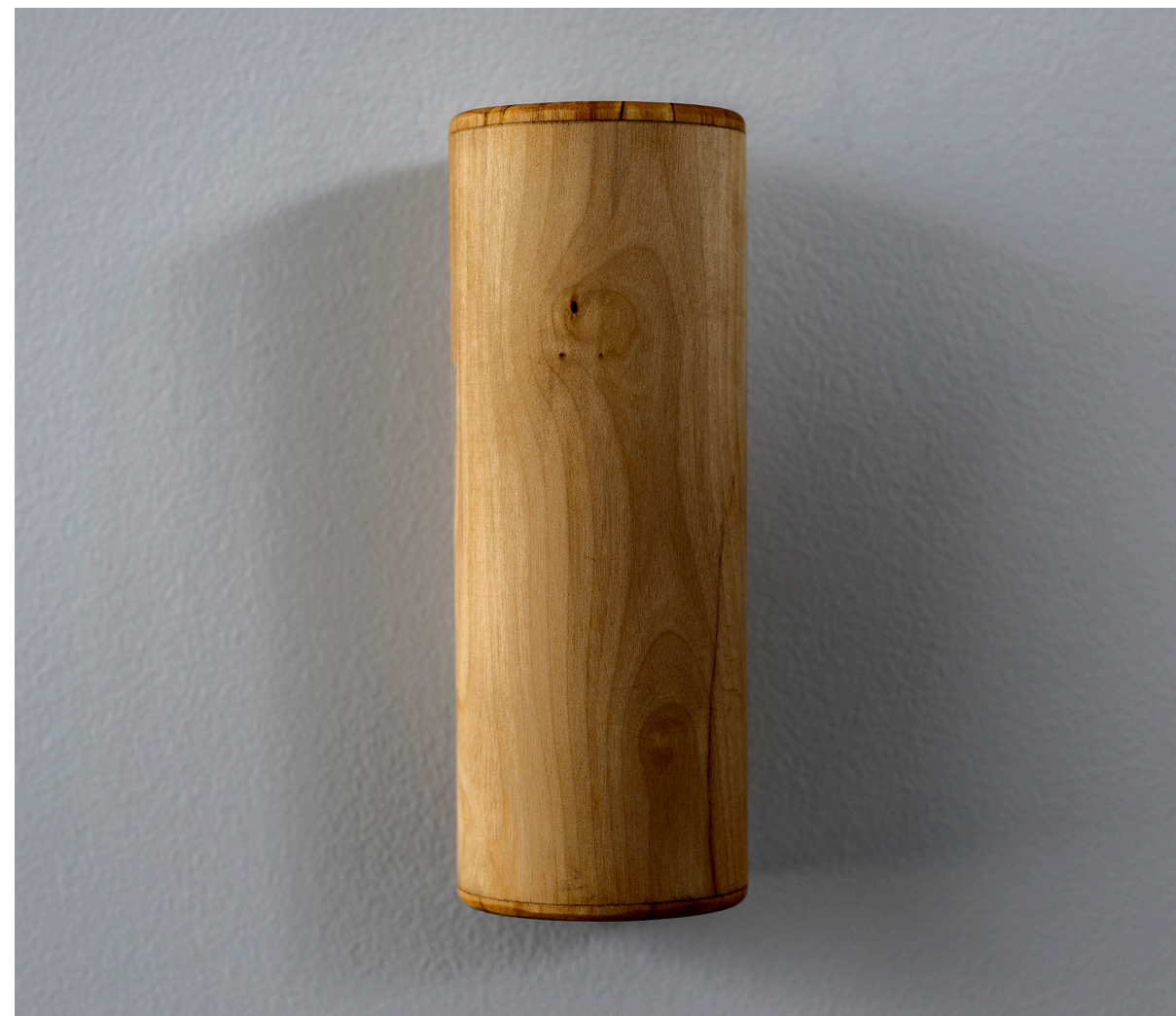
Heiðmörk 21.12.2221 - 22.12.2022, Suð-austur. Æting (Photogravure) 18 x 22 cm birkiaskja 6,5 x 18 cm. 2023