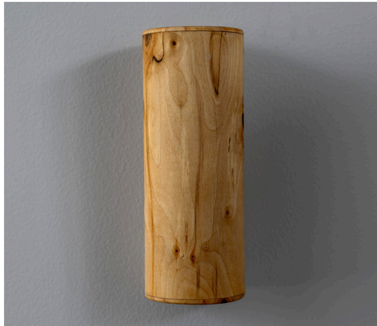
Heiðmörk 21.12.2221 - 22.12.2022, Vestur. Æting (Photogravure) 18 x 22 cm birkiaskja 6,5 x 18 cm. 2023